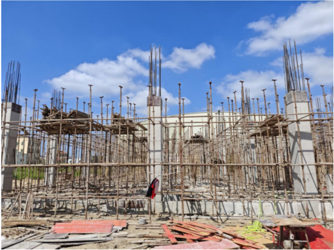
图 1 事故工地情况