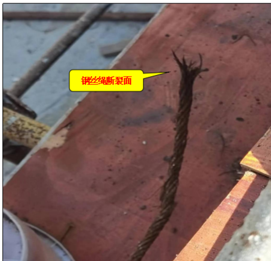
图 4-2 断裂的钢丝绳