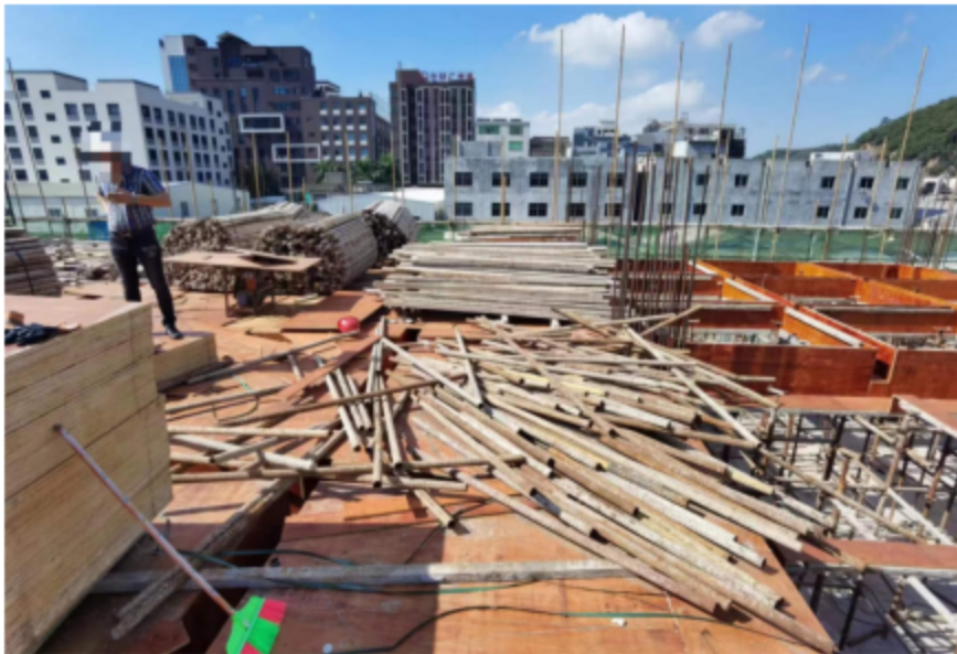
图3 工地在建3号楼3层梁板板面