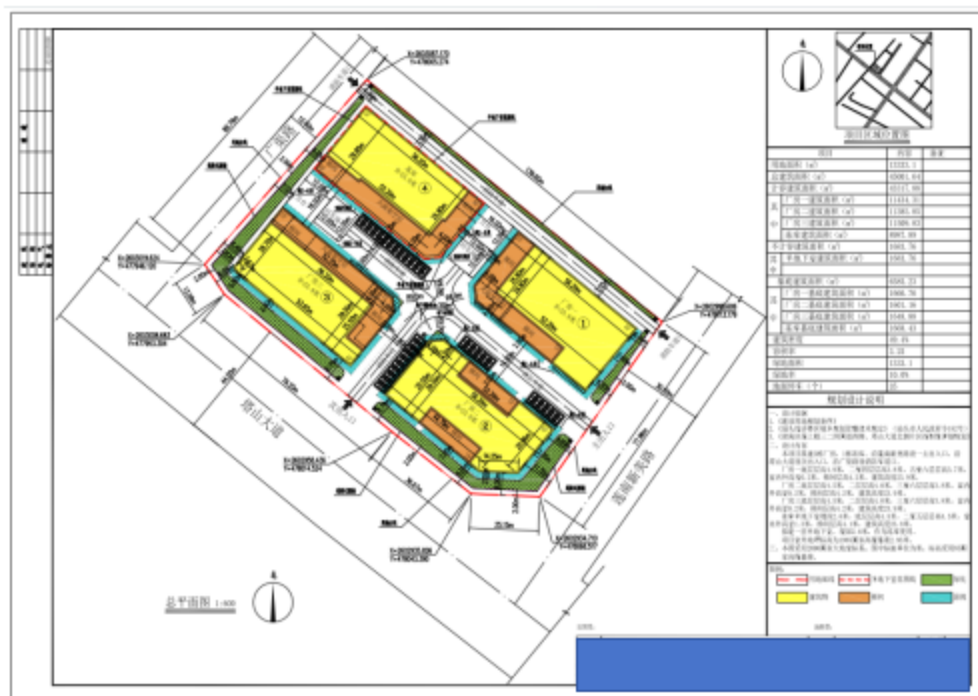
图 1*****有限公司厂房及配套项目工程

2. 该项目于 2022 年 8 月 3 日取得由汕头市自然资源局颁发的建设工程规划许可证（建字第 440515*****号）。