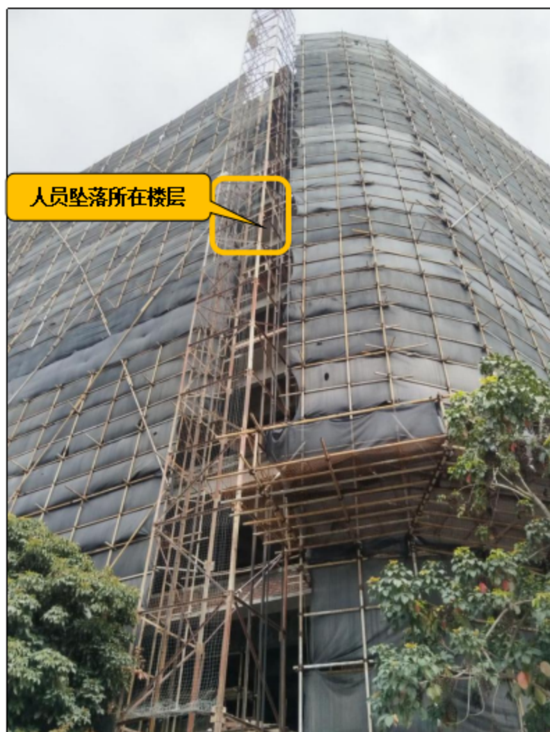
图 2 事故工地情况

二层以上（含二层）每层建筑建设面积约为 1380 平方米，至事发时该工地现场已完成主体结构施工并进入砌筑墙砖阶段，工地外墙设有扣件式钢管脚手架并挂设防护网（见图 2）。经调查，李某在建工地暂未取得相关报建手续。