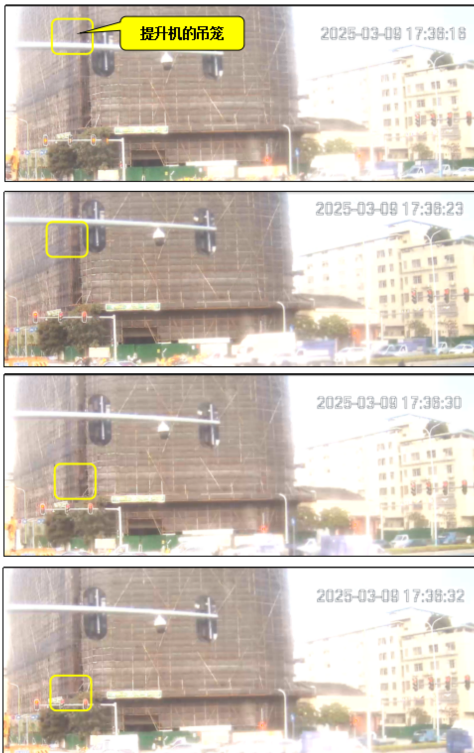
图 6 事发前物料提升机正常运转的时间轴影像