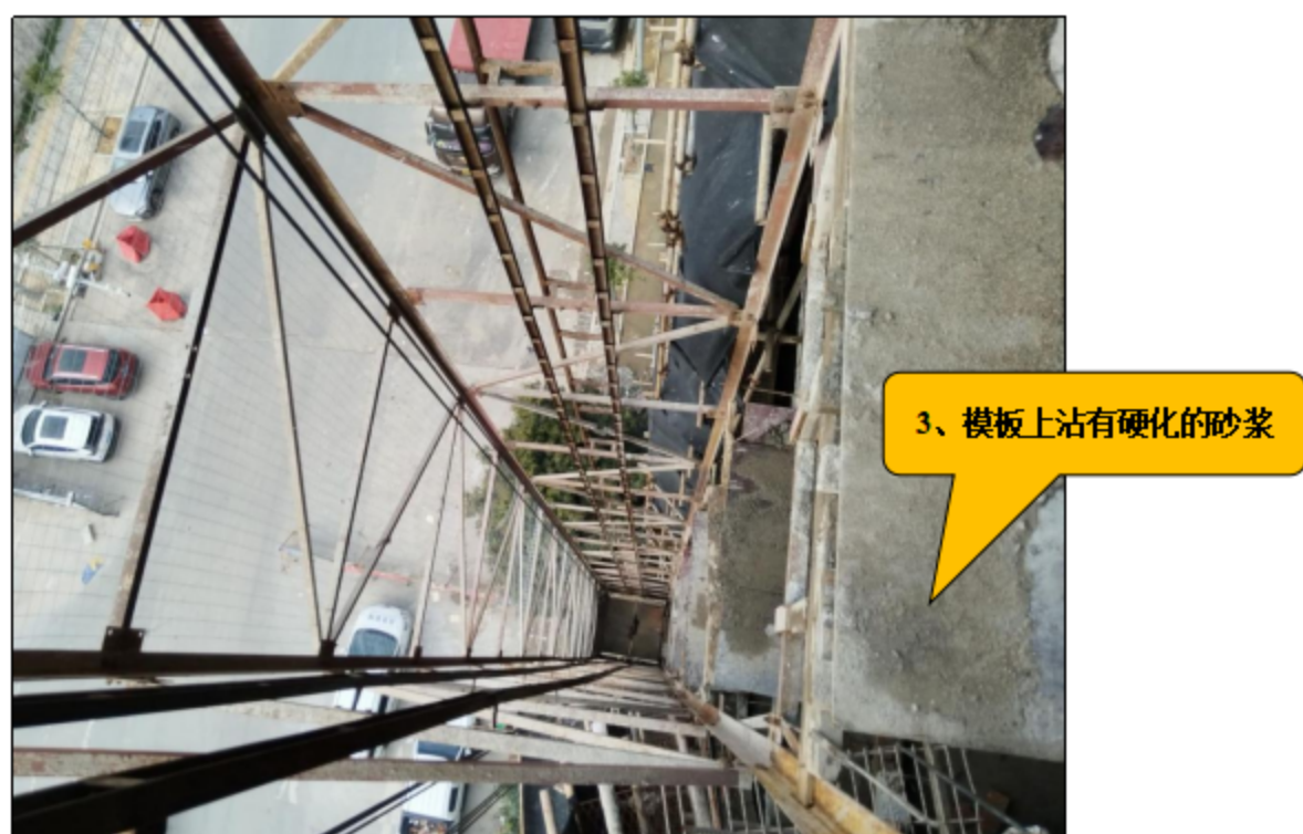
图 5-2 物料提升机六楼安全防护装置设置情况