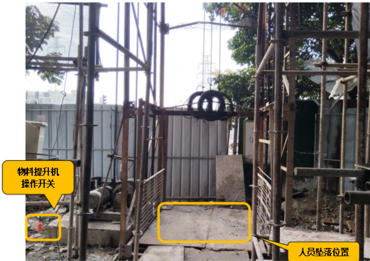
图 4 物料提升机地面情况

事发现场的第六层物料提升机停层平台位置敞开设置、未设置平台门，物料提升机吊笼停靠位置与停层平台相连的通道采用工地模板和方木简易铺设且未固定连接，模板面沾有部分硬化的砂浆，周边脚手架与结构层的缝隙未封闭。（详见图 5-1，5-2）。