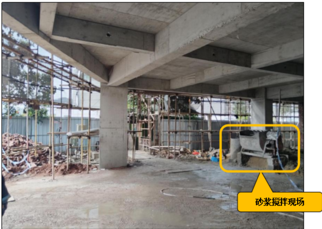
图3 物料提升机地面周边情况

工地设有一台物料提升机（又名井字架升降机）用于运载施工材料，事故中人员坠落在厂房首层地面的物料提升机吊笼中，物料提升机附近设有砂浆搅拌机用于搅拌砂浆（详见图3）。