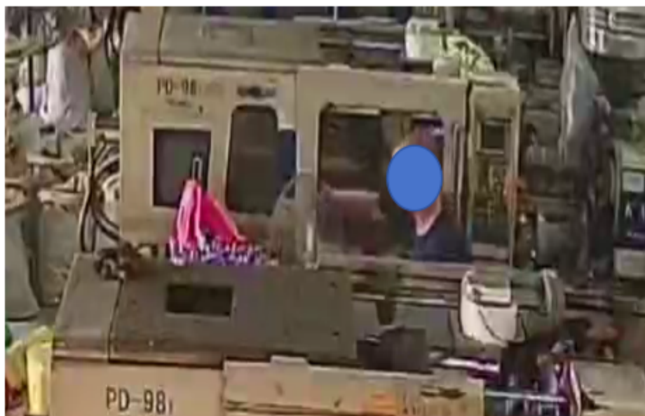
图 2-2 杜某某正在操作注塑机