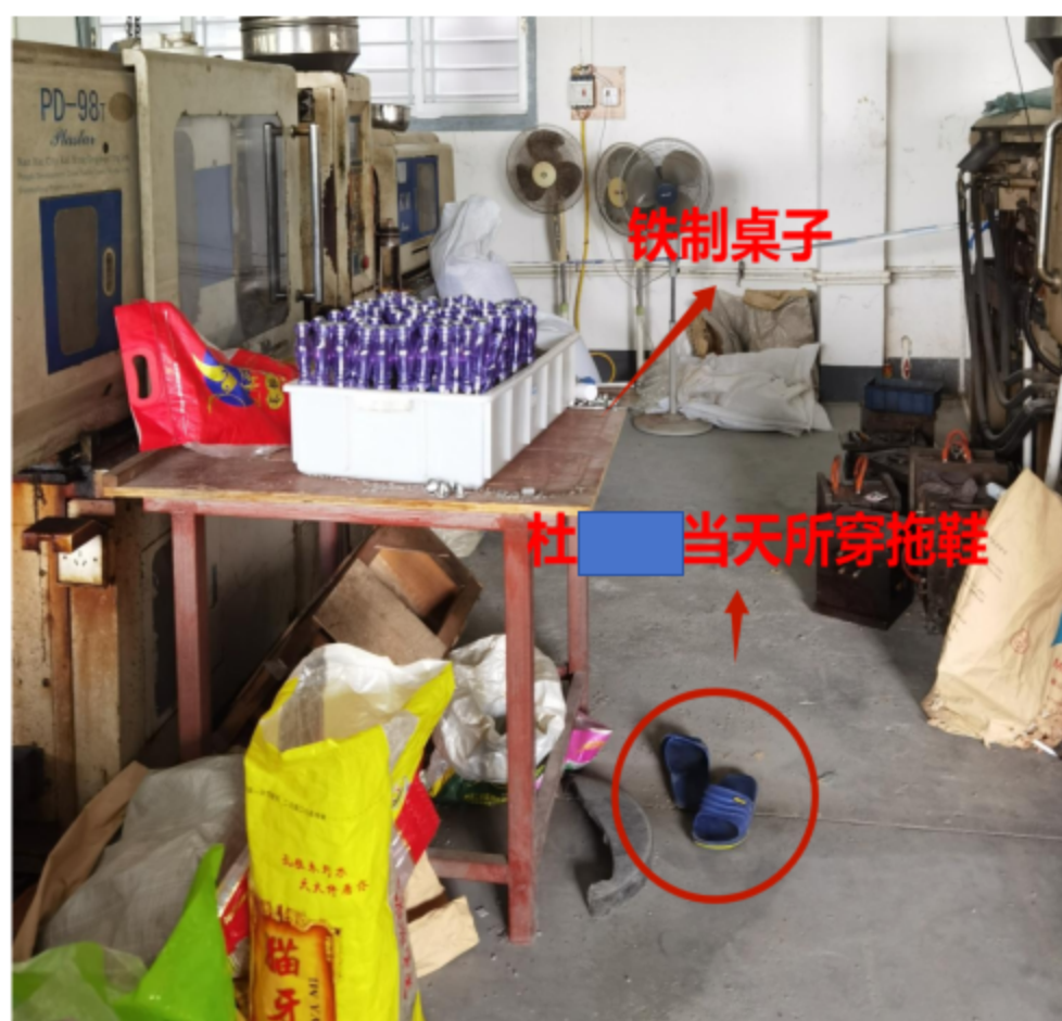
图 2-1 杜某某所操作注塑机前铁制桌子及当天所穿拖鞋

2023 年 6 月 25 日上午 8 时 30 分，杜某某身着短袖、长裤，脚穿拖鞋（图 2-1）到达工作岗位开始操作注塑机，并将注塑机生产成品放置于注塑机前铁制桌面（图 2-1）上（长：94cm 宽：94cm 高：78cm），用移动风扇（高 137cm）散热成品，该风扇电源线部分绝缘保护层破损，存在漏电隐患，电源线破损部位与铁制桌架接触，造成铁制桌架带电。上午 9 时 05 分左右，杜某某正在操作注塑机，脚不慎接触到铁架，同时手握注塑机铁制把手，形成电流回路，杜某某触电倒地。