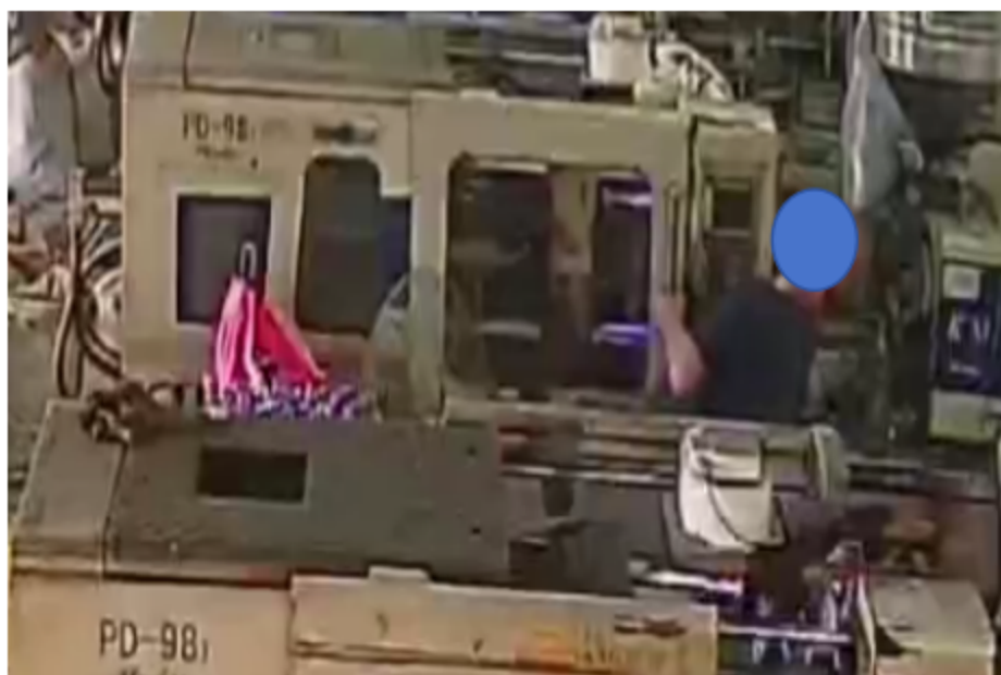
图 2-3 杜某某触电瞬间